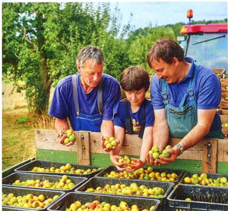
Von der Ernte bis zur Verarbeitung steckt in den Produkten viel Handarbeit.