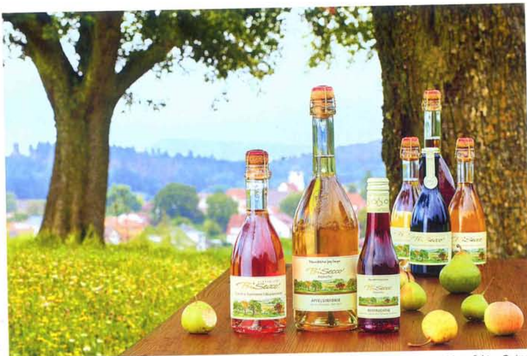
Alkoholfreie Priseccos aus schwäbischem Streuobst.